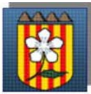
Associació de Veïns del Serrat